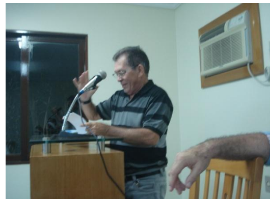
Esc. Francisco Bispo