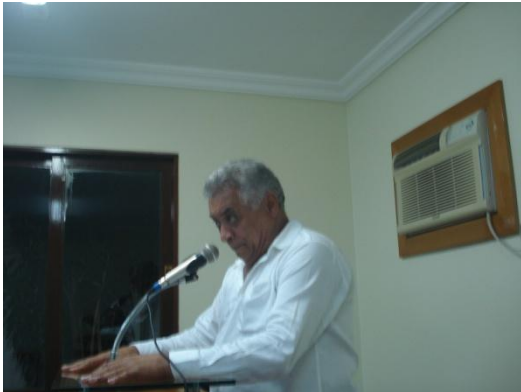
Ac. Oliveira de Panelas